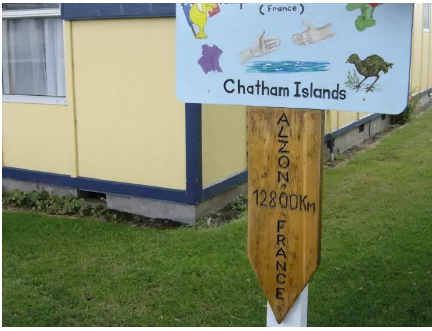
Sur l'île Chatham, devant le bureau de Poste de Waitangi, panneau symbolisant l'antipode d'Alzon apporté et érigé en 2000 par les Alzonnais

Nous allons à sa recherche dans la prairie à quelques trois cents mètres de la petite église. Nous y plantons une petite pancarte sur laquelle est inscrit « Alzon antipodes ».