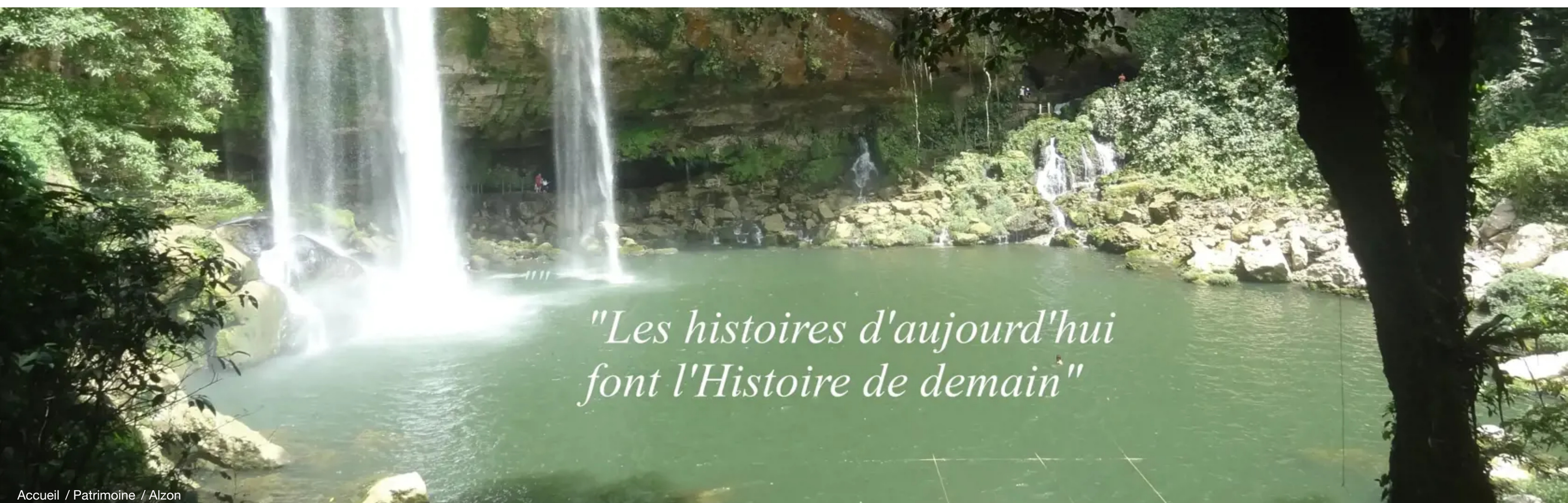
Accueil / Patrimoine / Alzon