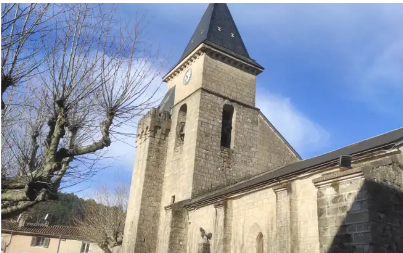
Clocher d'Alzon, département du Gard latitude 43° 58' 04" nord, longitude 3° 26' 25" est