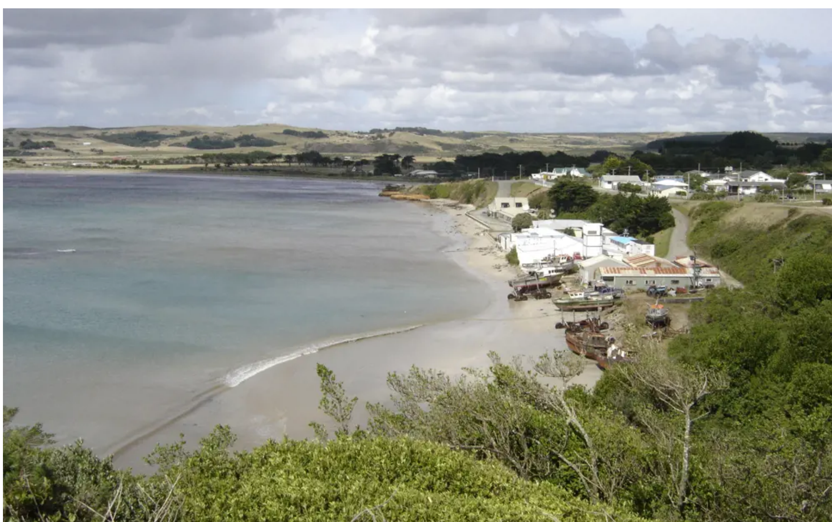
Waitangi, île Chatham, Nouvelle-Zélande

C'est une particularité en France métropolitaine. Alzon situé non loin du Vigan dans le Gard a son antipode exact dans l'océan Pacifique Sud, sur l'île néo-zélandaise, Chatham. Plus précisément à l'opposé de Waitangi, le seul village de ce petit archipel à quelques 800 km à l'est de l'île du sud de la Nouvelle-Zélande. Une situation géographique unique pour le petit village évennois car tout le reste du territoire métropolitain a ses antipodes qui tombent dans les profondeurs du Pacifique.