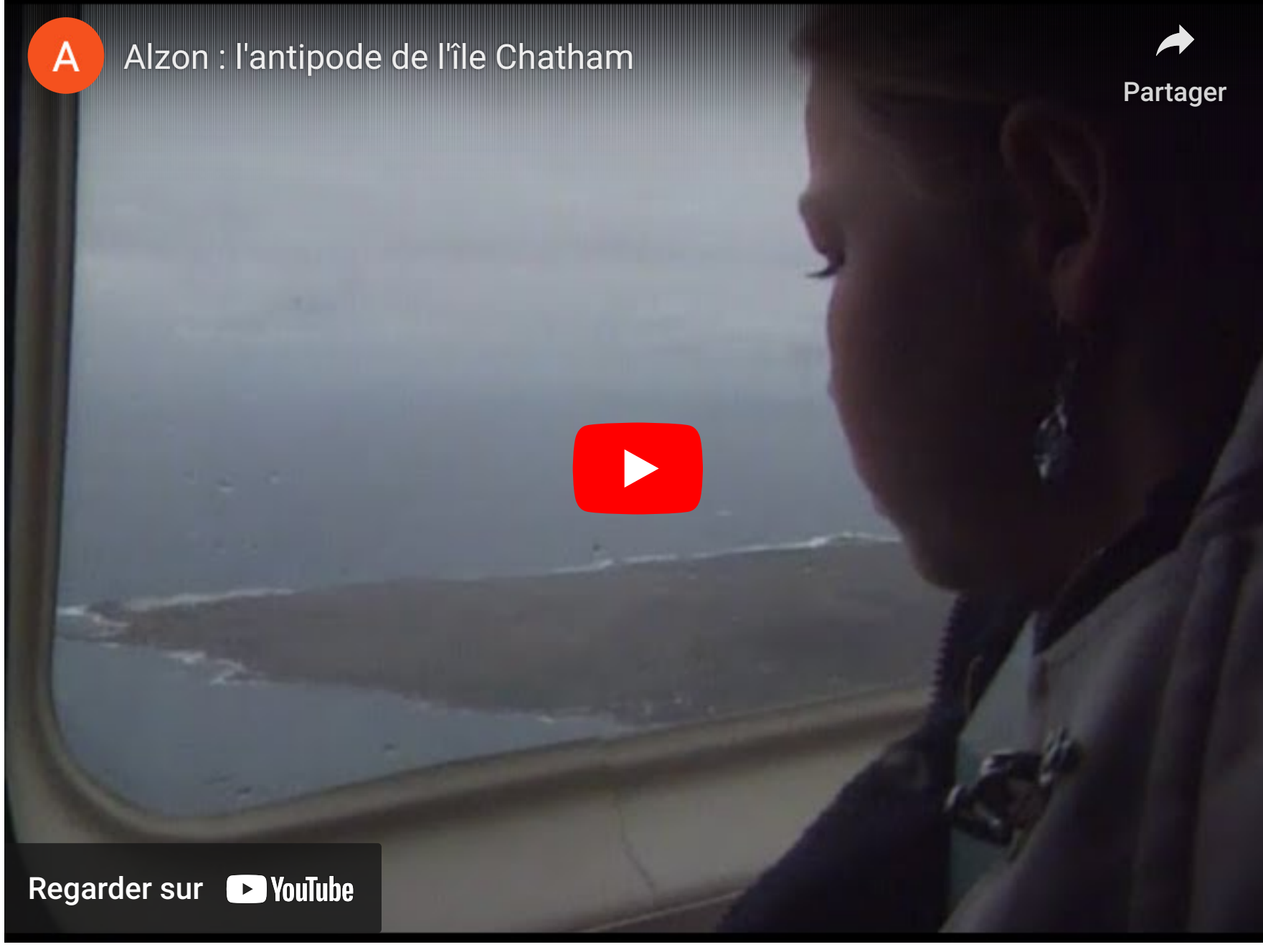
Reportage France 3 Languedoc-Roussillon diffusé le 1er janvier 2001

À cette époque-là, je suis journaliste à France 3 Languedoc-Roussillon. Je convaincs le rédacteur en chef de suivre cette aventure humaine. Avec mon collègue Jean-Michel Escafre, nous réalisons alors un reportage de 6 minutes diffusé le 1er janvier 2001.