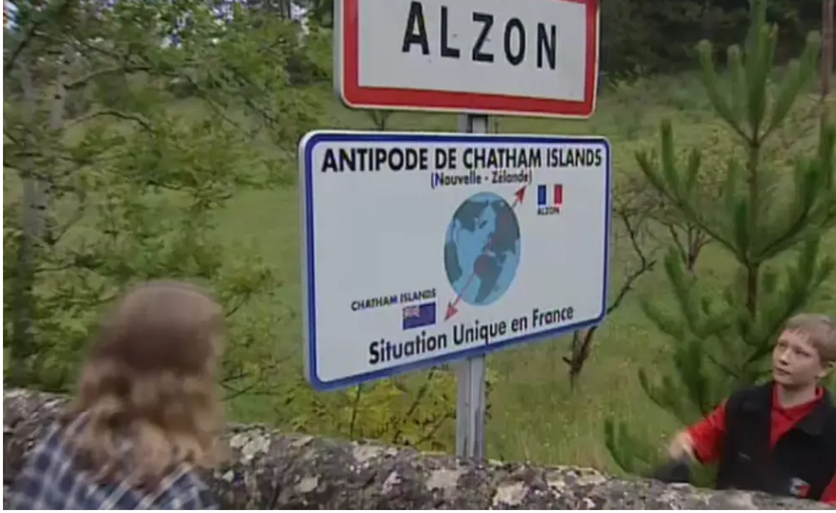
Inauguration en septembre 2002, de la visite de l'entrée Néo-Zélandaise, de la plaque symbolisant l'antipode de l'île Chatham à l'entrée d'Alzon

Aujourd'hui, 40 ans après cette découverte et une aventure humaine entre deux communautés, les relations se sont quelque peu étouffées. N'en demeure pas moins que Alzon et l'île Chatham garderont à jamais leur particularité géographique.